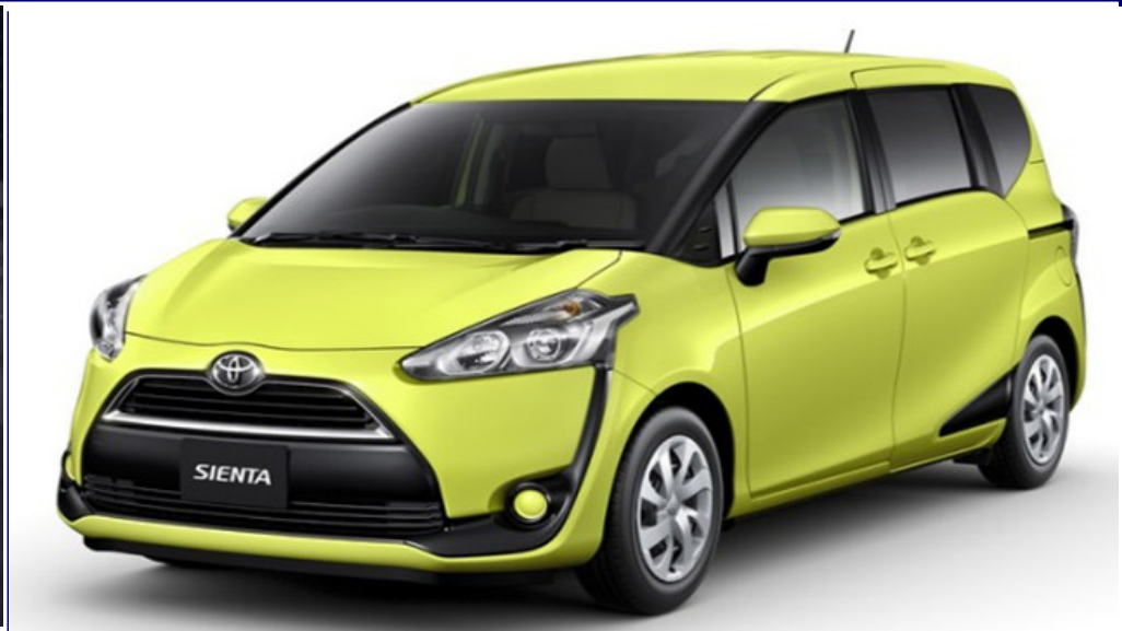
• TOYOTA SIENTA