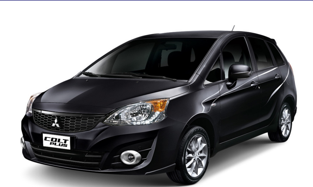
● MITSUBISHI COLT PLUS