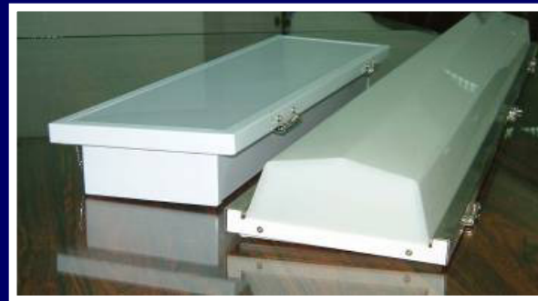
天花板燈(螢光燈管) T5/T8/T9 Ceiling Light