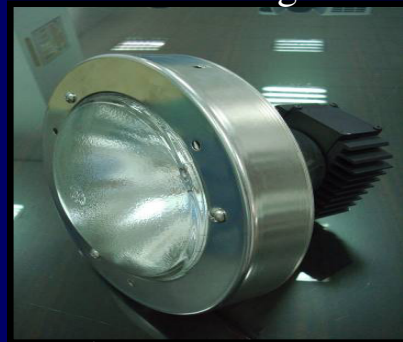
鹵素頭燈 Halogen Headlight