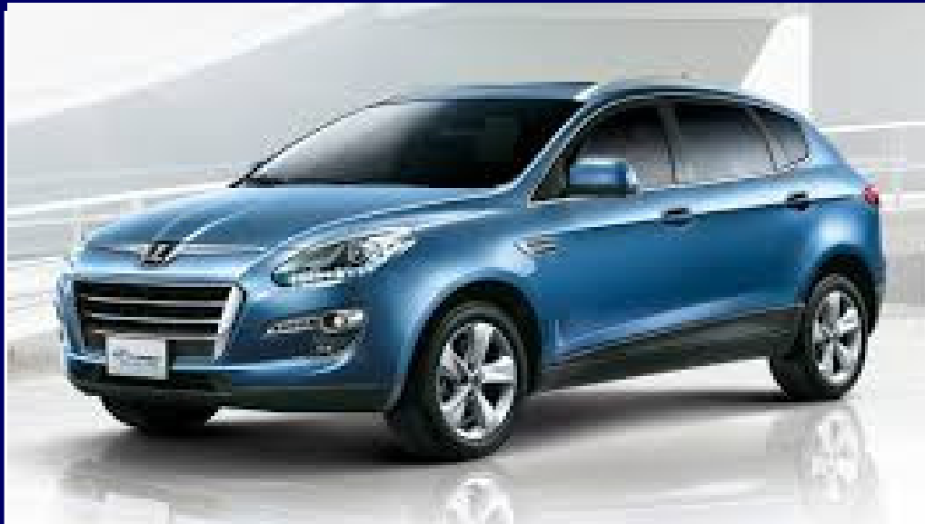
● LUXGEN U7