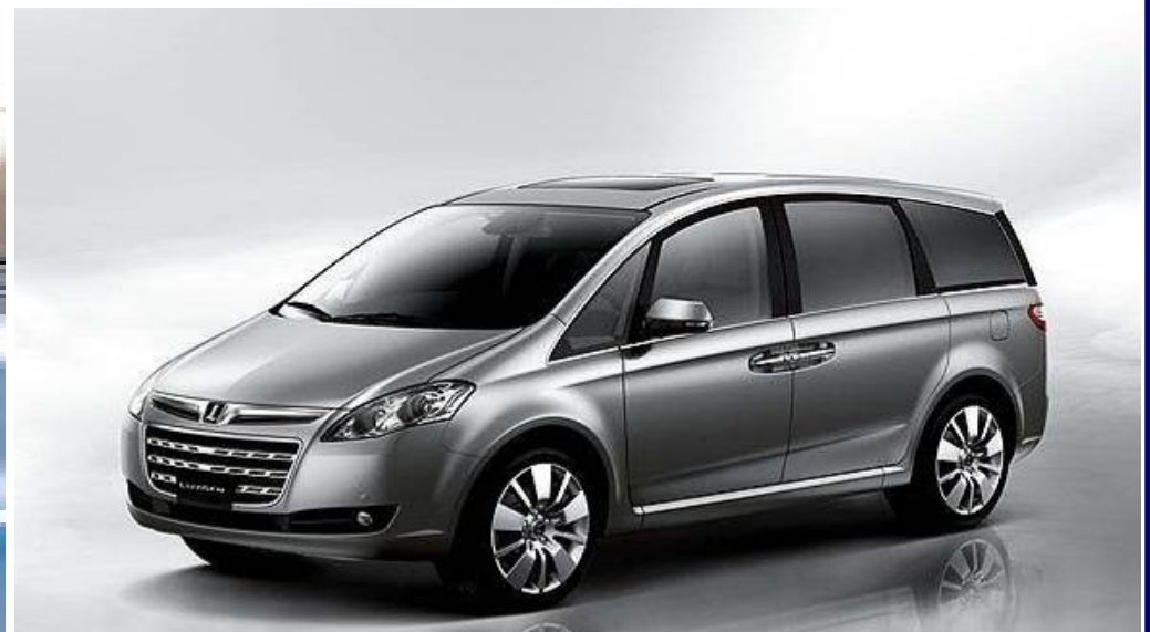
● LUXGEN M7