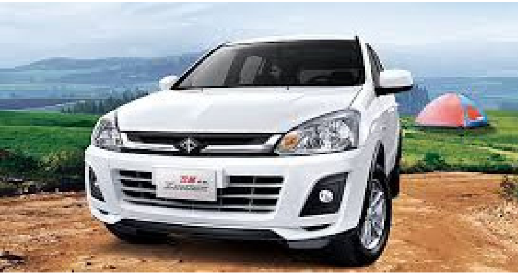
● MITSUBISHI ZINGER