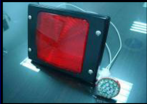
LED閃爍燈 LED Flash Light