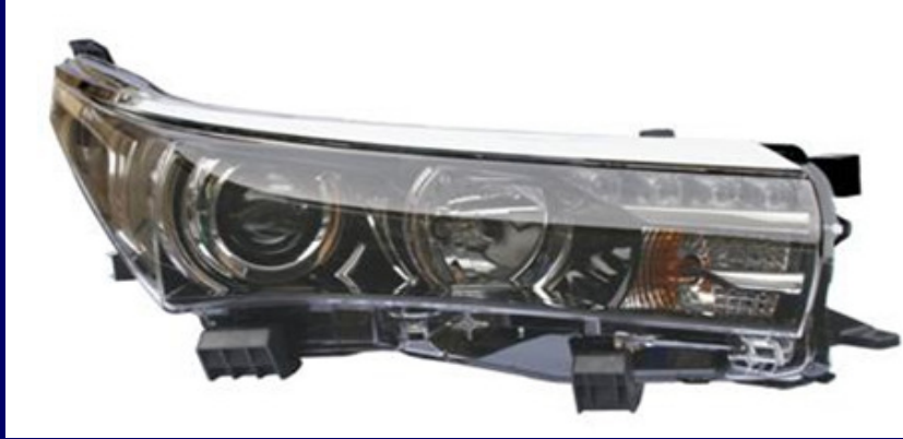
四輪用車燈 AUTOMOTIVE LAMP