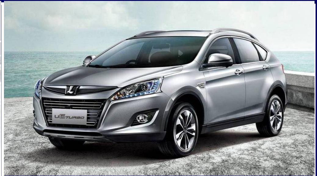
● LUXGEN U6