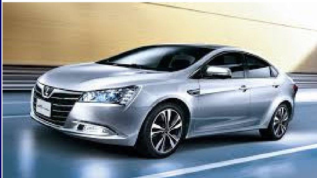
● LUXGEN S5