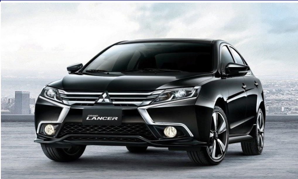
● MITSUBISHI LANCER