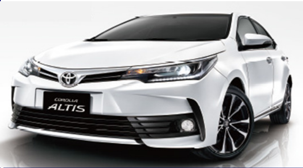
• TOYOTA ALTIS