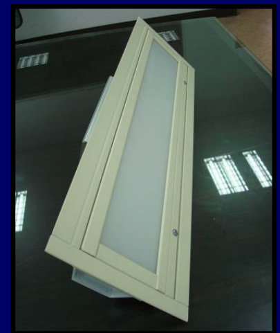
天花板燈(LED燈源) LED Design Ceiling Light