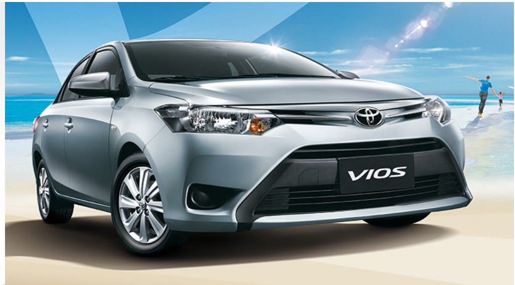
• TOYOTA VIOS