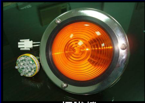
LED標識燈 LED MarkLight