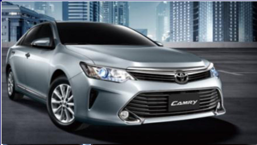
• TOYOTA CAMRY