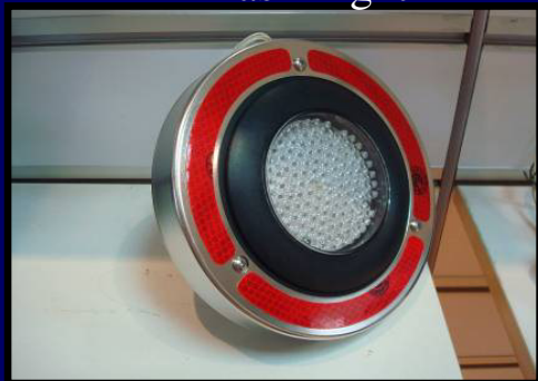
LED尾燈 LED Tail Light