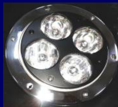
LED頭燈 LED Headlight