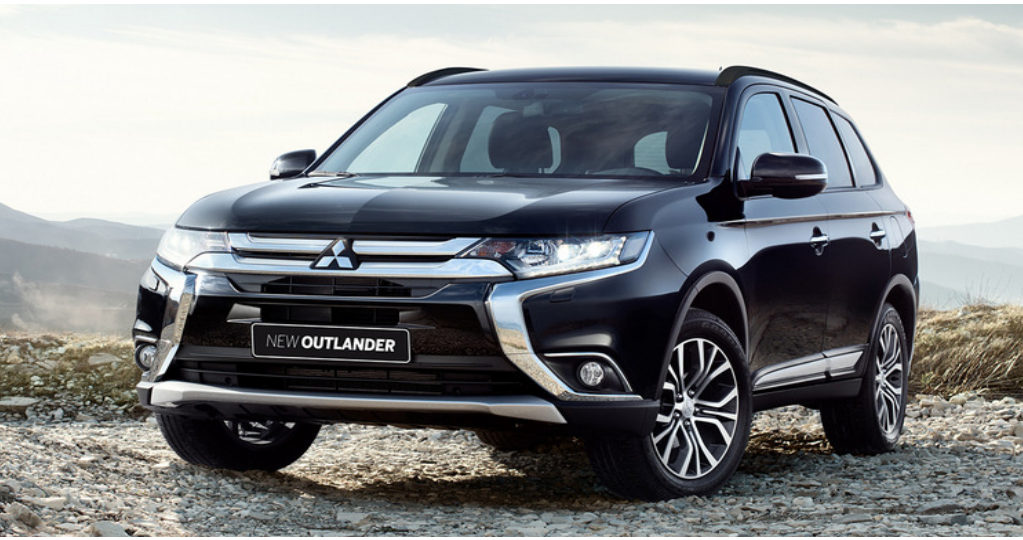
● MITSUBISHI OUTLANDER