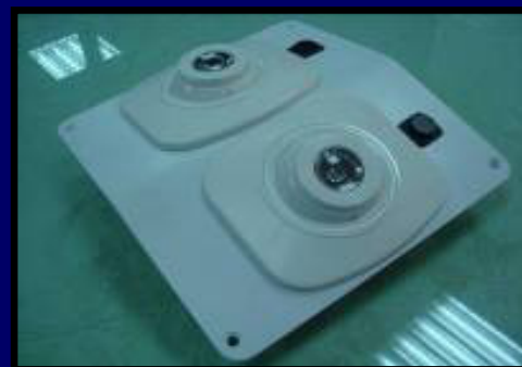
LED閱讀燈 LED Reading Light